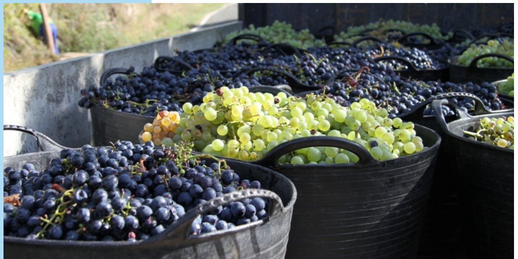
As vides expesan o esmero da man do viticultor. O froito das viñas, separado por castes, emprende o camiño da adega.