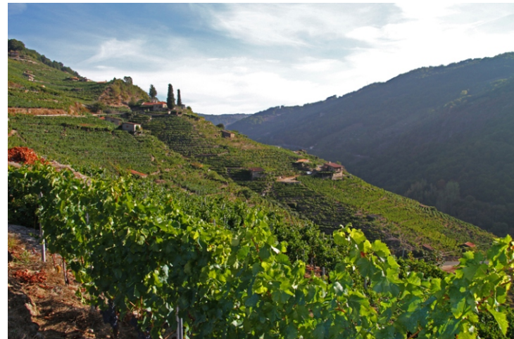
Viñedos e pequenas adegas na baixada a Belesar.