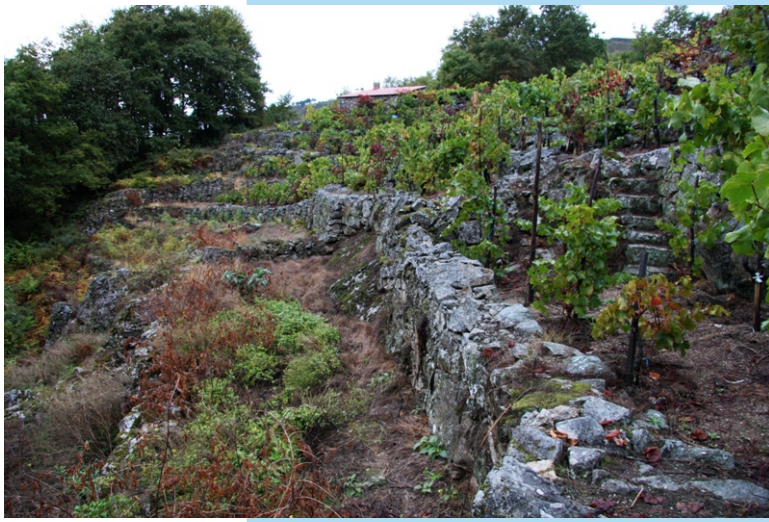
Socalcos e muras. O traballo de séculos segue a protexer os froitos de hoxe.